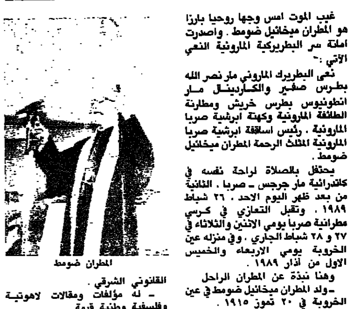
القسيس القبطي الشرقي - له مؤلفات ومقالات لاموتية وفلسفية ووطنية قيمة